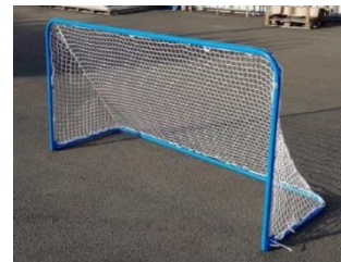
Paire de buts mobiles