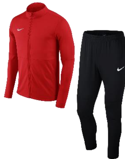
ROUGE / NOIR