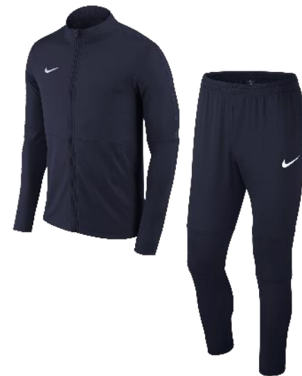
NAVY / NAVY