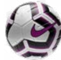
10 BALLONS NIKE TAILLE 5