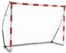
1 PAIRE DE BUTS 3X2

► Dotations offertes par la F.F.F. dans le cadre du plan de développement du Foot Loisir.