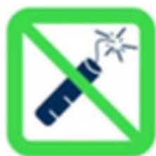
Articles pyrotechniques et matériels explosifs Pyrotechnics and explosive materials