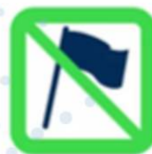
Hampes rigides, fagots de drapeaux Flagpoles