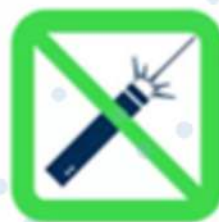
Pointeurs laser Laser Pointers