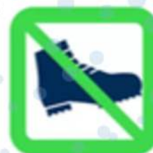
Chaussures de sécurité Safety Footweears