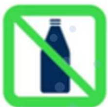
Bouteilles - Contenants à bouchon - Verres - Canettes - Bottles - Cork containers - Glasses - Cans